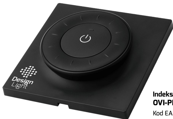
Indeks: OVI-PILOT-MONO-15-CZ-01 Kod EAN: 5908293417961