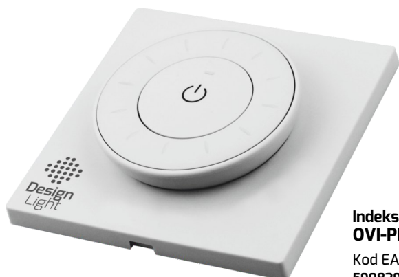
Indeks: OVI-PILOT-MONO-15-BI-01 Kod EAN: 5908293417954